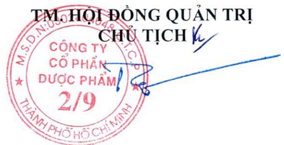
Ngô Nam Thắng

Trên đây là báo cáo kết quả hoạt động năm 2024 và phương hướng năm 2025 của Công ty Cổ phần Dược phẩm 2/9. Kính trình Đại hội thông qua.